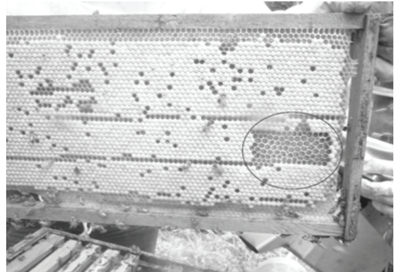
Figura 2. Desoperculación de crías muertas como comportamiento higiénico en los apiarios de Huimanguillo, Tabasco.

confers them disease resistance. Thus, they cut the cycle of bacterial or fungal diseases or well of V. destructor Guzmán-Novoa et al. (2011) (Figure 2).