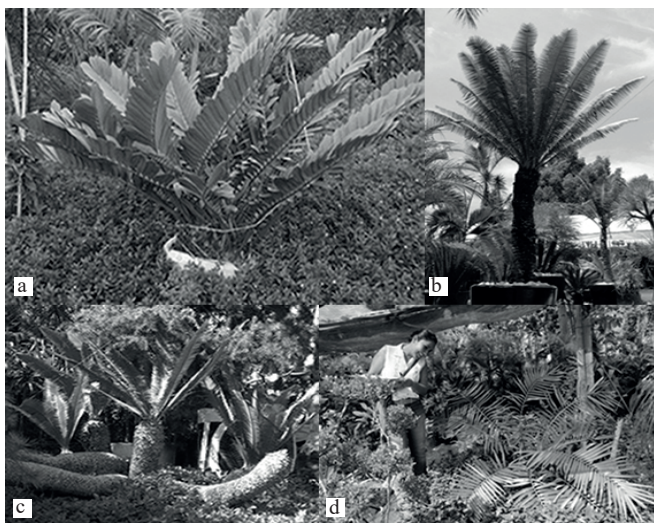
Figura 2. Especies de cícadas mexicanas comercializadas en Atlixco: a) Zamia furfuracea ; b) Dioon spinulosum ; c) Dioon edule ; y d) Ceratozamia sp. Figure 2. Mexican cycad species marketed in Atlixco: a) Zamia furfuracea ; b) Dioon spinulosum ; c) Dioon edule ; and d) Ceratozamia sp.

En total se contabilizaron 143 individuos de especies mexicanas: 75 de Zamia furfuracea , 34 de Dioon edule , 30 de D. spinulosum y 4 de Ceratozamia sp. De éstas 143 plantas, 48 fueron pequeñas, 54 juveniles y 41 adultas en edad reproductiva (11 machos, 9 hembras y 21 de ellas el sexo no se pudieron determinar), de los cuales 14 fueron de D. edule , 4 de D. spinulosum , 22 de Z. furfuracea y 1 de Ceratozamia sp. Tomando en cuenta la presencia de conos o remanencia de éstos se pudo comprobar que se están comercializando plantas en edad reproductiva (Figura 3a). En los viveros tipo IV y V se ubicaron al 70.6% de las plantas totales encontradas (Figura 3b); en estos mismos viveros se vendían la mayoría de plantas adultas. D. caputoi (Figura 1) no se encontró bajo comercialización en ninguno de los viveros visitados en Atlixco.