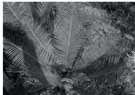
Figura 1. Dioon caputoi , especie endémica del estado de Puebla bajo producción sustentable (UMA) en la Reserva de la Biosfera Tehuacán-Cuicatlán.

Considering this, it is recommended: (1) conducting studies prior to nursery market development; (2) finding the right market; and (3) enabling consumer awareness about conservation work required by the product. This would make Mexican cycads a valuable and appreciated commodity, with acknowledged certification. In response to this problem, overall aim of this study was to determine the conditions for Mexican cycads marketing in Atlixco, Puebla. As particular objectives were considered: a) Identify the marketed Mexican cycads species; b) determine the level of knowledge on them by traders and potential consumers of ornamental plants; c) register the trading prices of Mexican cycads; and d) explore the willingness of potential marketers and consumers to purchase Dioon caputoi an endemic plant from State of Puebla and endangered species (Figure 1).