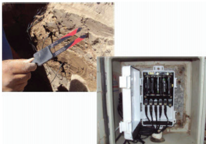
Figura 2. Sensor de humedad del suelo 10HS Decagon Device instalado en lote experimental para calibración del modelo integral.