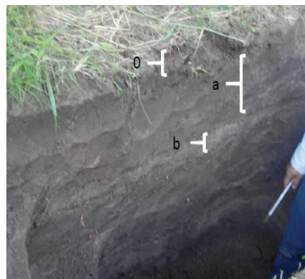
Figura 1. Pozo agrológico para determinación de profundidad de raíz y parámetros del modelo integral asociados a esta.

Kmax was taken from Stein and Worthington (1996), while the depth of root was performed by direct sampling in agronomic wells of 0.50 mx 1.5 mx 2 m, where Pro and PRMAX model was determined, as shown in Figure 1.