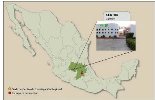
Figura 1. Localización del área del CEBAJ- INIFAP. Figure 1. Location of area CEBAJ-INIFAP.

is classified as vertisol, loamy texture, pH 7.8, containing organic matter 2.31%, nitrogen N 5.6 mg kg -1 , phosphorus P 12.3 mg kg -1 and potassium K, 1 016 mg kg -1 .