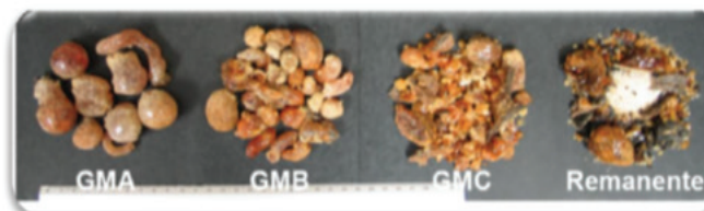
Figura 2. Clasificación manual de las gomas.

Then the images of the classification shown gums: