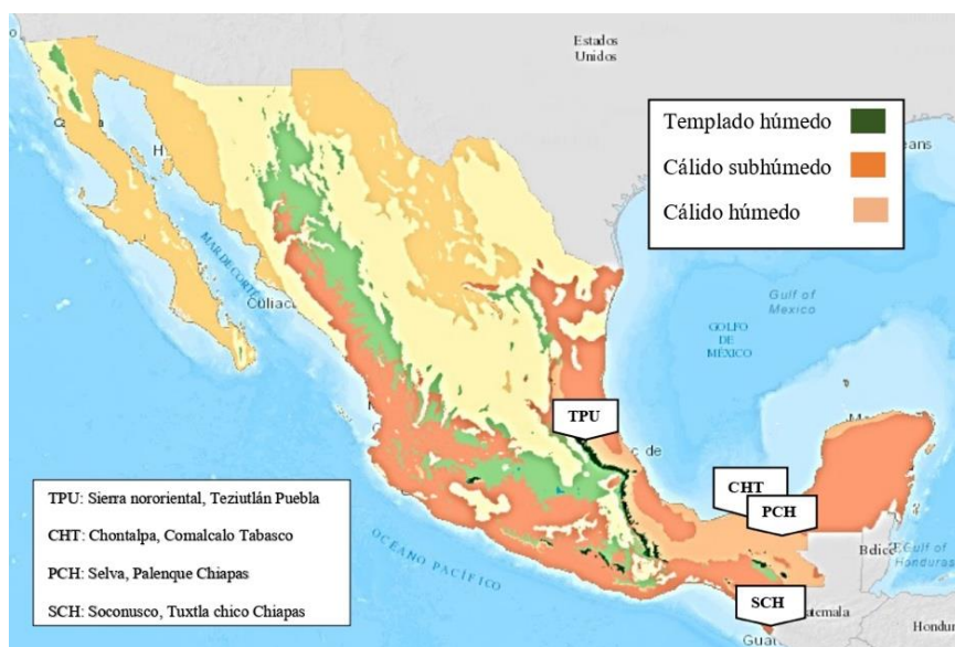
Figura 1. Distribución climática de las diferentes regiones de colecta de frutos de Persea schiedeana Nees en México (SEMARNAT, 2019; modificado por Quiñones-Islas, 2022).