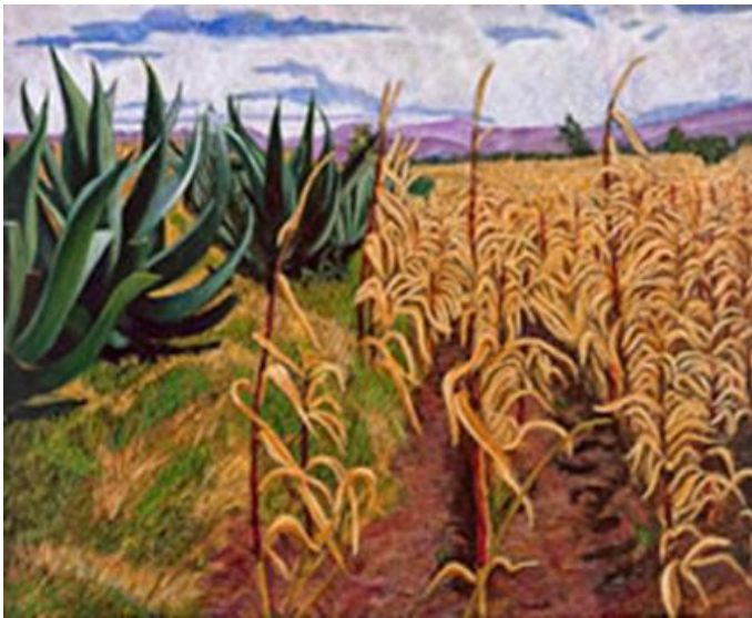
Figura 6. Maguey pulquero intercalado con maíz ( http://www.pedrodiegoalvarado.com/obra_paisaje.htm ).

El agave y el maíz han sido fundamentales como base nutricional en la vida de los pueblos de México a lo largo de su historia (Figura 6).