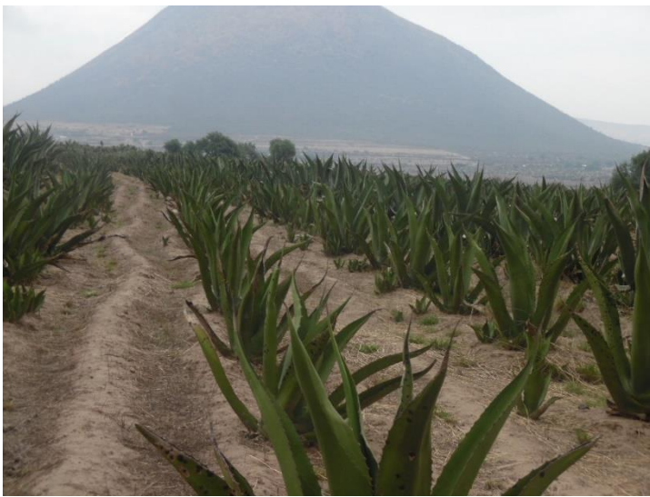
Figura 5. Plantación intensiva de maguey sembrado en surco, municipio de Zempoala, Hidalgo.