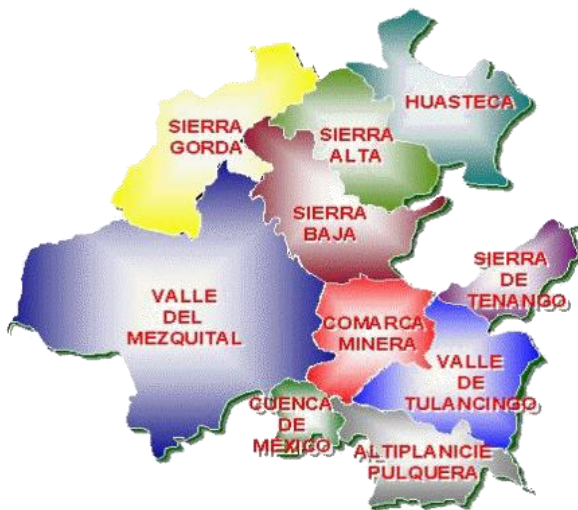
Figura 1. Regiones del estado de Hidalgo. http://www.inafed.gob.mx/work/enciclopedia/EMM13hidalgo/regionalizacion.html .

Esta regionalización agrupa a los 84 municipios del estado de Hidalgo en diez regiones geográfico-culturales: la Huasteca, las sierras Alta, Baja, Gorda y la de Tenango, el Valle de Tulancingo, la Comarca Minera, la Altiplanicie pulquera, la Cuenca de México y el Valle del Mezquital (Roldán, 2017) (Figura 1).