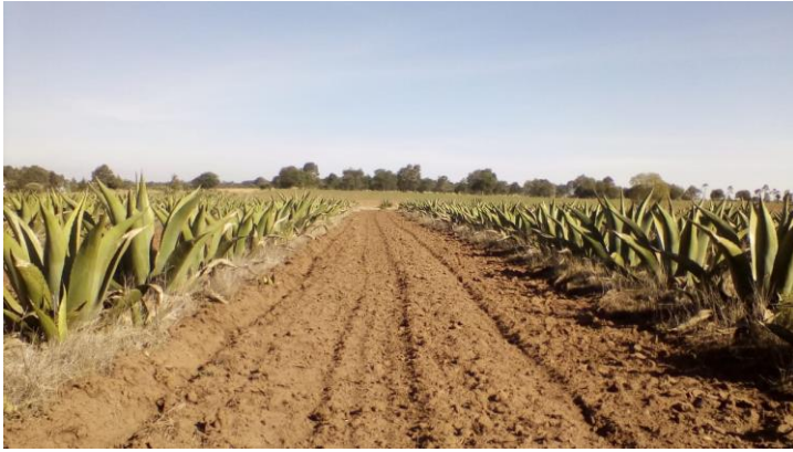
Figura 4. Plantación de agave pulquero combinado con cultivos anuales.