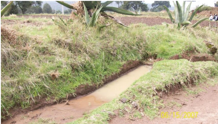
Figura 2. Zanjonés para cosecha agua de lluvia en la comunidad de Álvaro obregón, Españita, Tlaxcala.