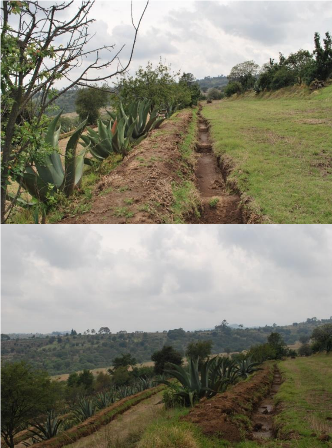
Figura 3. Terrazas conformadas con maguey pulque y árboles frutales.

velocidad del agua corra con saturación y sin arrastres del suelo fértil (Ruvalcaba, 1983). En la (Figura 3) se observan bordos sembrados con maguey, frutales y zanjones para retención de agua. En la actualidad con ayuda de la tecnología se pueden diseñar terrazas de excelente calidad a base de planos topográficos y cálculos matemáticos; sin embargo, cabe destacar la experiencia acumulada de los productores que diseñan sus bordos y terrazas basándose en su experiencia. En México se maneja el terracedo desde la época prehispánica.