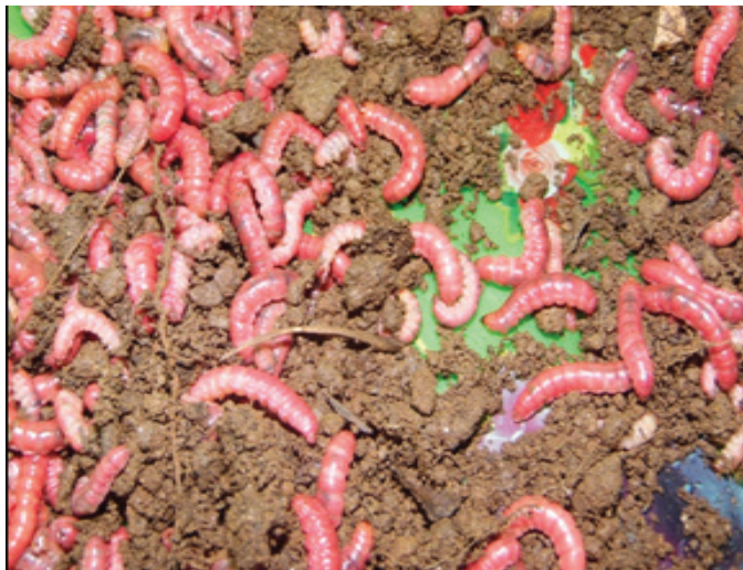
Figura 3. Gusano de chamizo o “gusano de oro” ( Scyphophorus acupunctatus ).

Otro grupo de productos recolectados del bosque están los condimenticios (8%). En este grupo de productos están los berros ( Nasturtium officinale ) que se encuentran en las orillas de los arroyos y ciénegas que las familias usan como ensalada para acompañar sus alimentos. En este grupo está también el gusanito de chamizo o “gusano de oro” ( Scyphophorus acupunctatus ) que es una larva usada para preparar salsas que acompañar a los alimentos de las familias de la localidad, o bien una vez secos y molidos son mezclados con sal y chile en polvo denominado “sal de gusanito” que suele utilizarse como condimento de frutas y para acompañar las bebidas como el mezcal (Figura 3). Otro producto condimenticio que las familias usan para en la elaboración de tamal es el “chepil” ( Crotalaria longirostrata ), que le da un sabor especial al paladar y que gusta a las familias de la región.