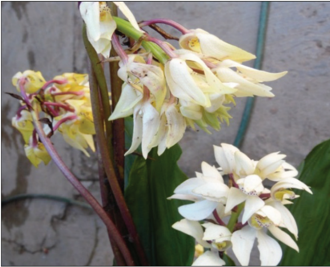
Figura 4. Flores de ornato colectadas en el bosque. Figure 4. Ornate flowers collected in the forest.

No menos importante está las rajás de ocote (4.4%) que por su resina que contiene el árbol de ocote ( Pinus sp.) sirve de combustible para alumbrar y encender el fogón de los hogares. Otro producto importante está la “tierra de monte” (2.2%) que por su contenido de humos y nutrientes las familias lo usan en la preparación de sustratos para la siembra de diferentes hortalizas y plantas de ornato en los traspatios.