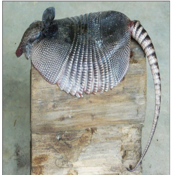
Figura 5. Armadillo ( Dasyus novemcinctus ). Figure 5. Armadillo ( Dasyus novemcinctus ).

Another group of PFMN are game animals (17.8%) like rabbits ( Oryctolagus sp.), squirrels ( Sciurus vulgaris ), armadillo ( Dasypodidae ), tlacuaches ( Didelphimorphia ), skunks ( Mephitidae ) and deers ( Odocoileus virginianus ) the consumption of their meat provide protein to the diet of families. The practice of hunting and catching animals in the forest are activities that are widely disseminated among the inhabitants of the community (Figura 5).