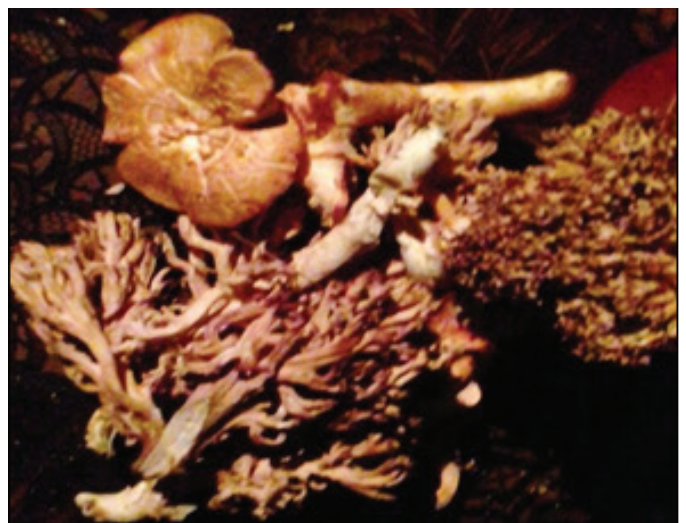
Figura 2. Hongo rojo ( Amanita caesarea ) (superior) y hongo de venado ( Ramaria sp.) (inferior).

The research found that 80.4% of the families interviewed realized the use of PFNM in 2015. The families collected several useful forest products from the forest, medicinal, and ornamental. Among the products highlighted were edible fungi (86.7%) locally known as “nanacates” including yellow fungus ( Cantharellus cibarius ), deer ( Ramaria sp.), Red ( Amanita caesarea ) and ocote ( Pleurotus drynus ). The fungi grow in the rainy season so they were collected between the months of April and September. In the collection of fungi, women, girls and children frequently participate (Figure 2).