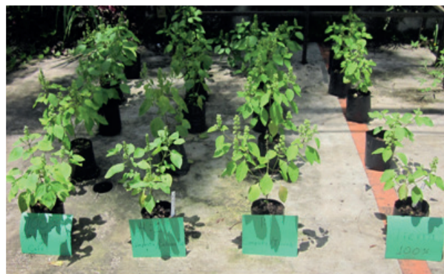
Figura 1. Tratamientos de albahaca con cuatro sustratos. De izquierda a derecha: 100% vermicomposta de café, vermicomposta de café cascarilla de café 4:1, composta tierra 1:1, tierra.

La Figura 2 muestra altura y número de hojas de la albahaca a través del tiempo. La altura de planta presentó diferencias significativas ( < 0.05 ) en las tres etapas de muestreo. Se observó que en el tratamiento con tierra la altura de planta fue superior al inicio del establecimiento y 8 días después del trasplante. Esto se vio favorecido por la mayor capacidad de retención de agua de la tierra, lo cual es crucial en la etapa de adaptación inmediata al trasplante (Cuadro 2). No obstante, a