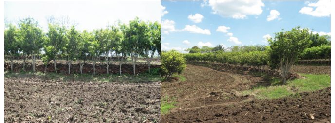
Figura 4. Sitio de investigación-demostración con MIAF-chicozapote en el año 2013, plantado en 2003, en un Vertisol en ladera con pendiente de 18% en la región de Los Tuxtlas, Veracruz.

way, one with fruit trees and the other with milpa. With this intensification there is an advantage of the interaction between botanically different species and complementary to each other, in the use of space and time.