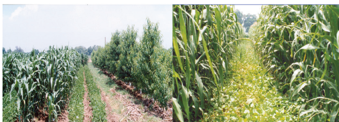
Figura 3. Módulo MIAF- duraznero con arreglo topológico de dos surcos alternantes de maíz y frijol e hilera de duraznero bajo riego. CEVAMEX, 2004.

El espacio total de un módulo MIAF fue asignado en tercios de seis surcos cada uno, al durazno, maíz y frijol arbustivo. El tercio central fue asignado a una hilera de durazno y dos tercios flanqueantes al maíz y frijol, éstos en seis tiras alternantes de dos surcos de maíz y dos de frijol. En la Figura 3 se muestra el arreglo topológico de MIAF y la penetración de la RFA en el maíz, propiciado por las tiras flanqueantes de frijol arbustivo.