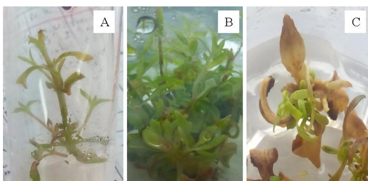
Figura 1. Respuestas organogénicas in vitro a partir de segmentos de tallo de Stevia rebaudiana Bertoni. A) brotes obtenidos con 0.3 mg L -1 de BAP; B) brotes obtenidos con 0.5 mg L -1 de BAP y C) apariencia de brotes obtenidos con 1 mg L -1 de PAB después de 45 días de cultivo in vitro .

Respuestas de segmentos nodales de Stevia rebaudiana Bertoni por tratamiento. Los tratamientos que tienen la misma letra, no son estadísticamente diferentes (Tukey, p=0.05 ).